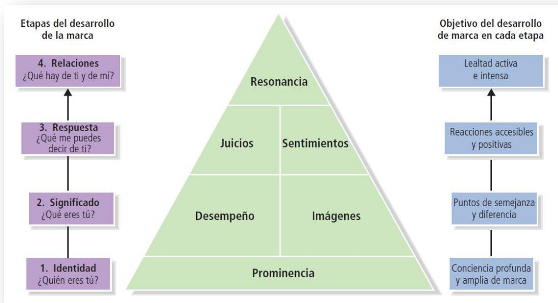
Figura 2. Modelo de construcción de marcas - Pirámide de valor capital de la marca basado en el cliente.