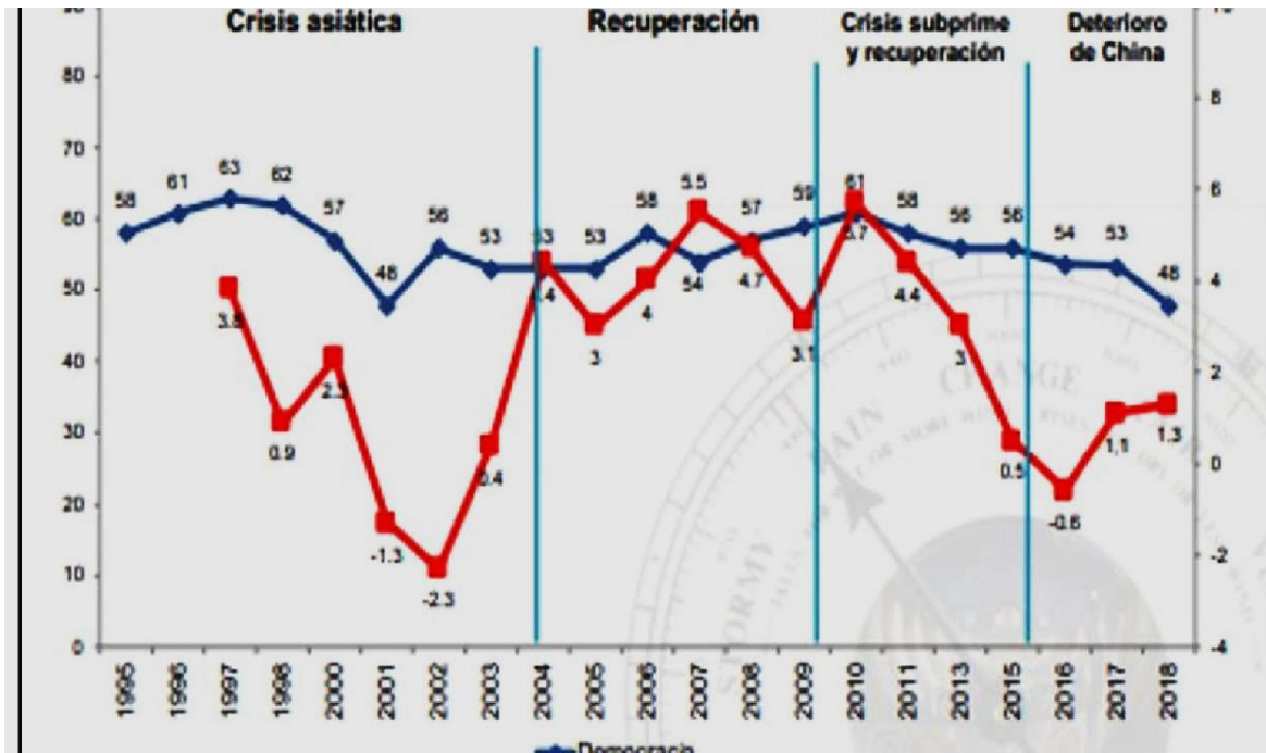
Cuadro N.º 3 Apoyo a la democracia y crecimiento PIB per capita (Total América Latina 1995-2018)