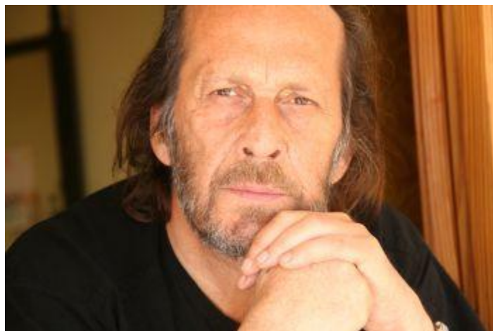
Reconoce peruanidad del cajón

Hace unos años, en Ginebra, Suiza, participé de una velada donde a una señora española muy simpática le hice escuchar las Cumananas de Nicomedes Santa Cruz. A cada danza descrita en la popular grabación, la señora le encontraba un parecido con alguna otra danza o manifestación musical española. De seguro tendría razón, por ejemplo, los pregones y el zapateo, en su versión peruana, son en realidad fusiones o adaptaciones de géneros originariamente españoles.