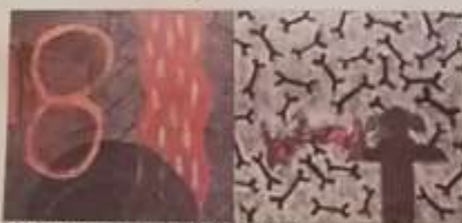
El Dístico creado con su hijo. El Universo de María I.

la misma manera y es una forma de vivir que me permite una búsqueda permanente de quién soy y cuánto puedo ser. La parte compleja de este asunto es que vivo en un mundo cargado de certezas a todo nivel, porque todos los días temas que reinventar y en eso encuentro una rigurosa rutina.