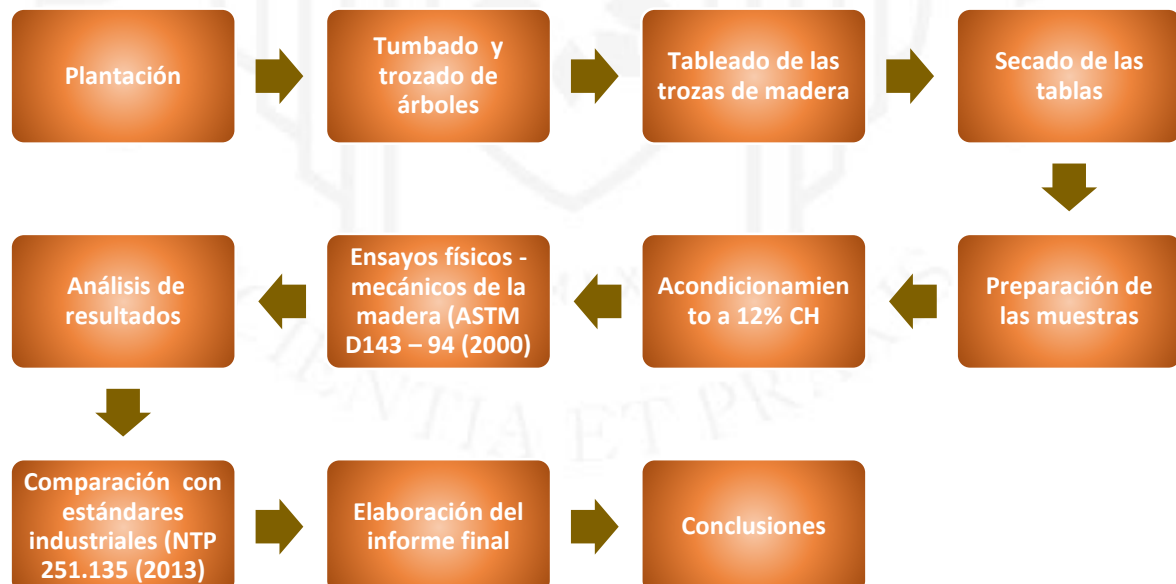
Diagrama de propiedades físico-mecánicas de la madera para pisos sólidos

Resultados, discusión de los resultados y conclusiones: Evaluación, análisis y presentación de los hallazgos obtenidos en las pruebas, comparándolos con estándares industriales y especies maderables provenientes de bosques naturales, utilizadas en la producción de pisos de madera maciza.