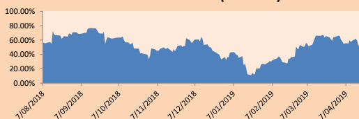
Correlación Rend. Índice Minero vs Índice de Metales de Londres (3 meses)