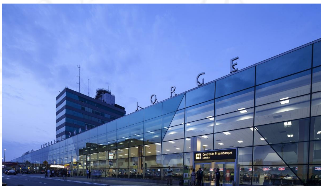
Aeropuerto Internacional Jorge Chávez