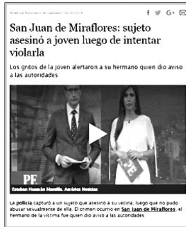
Figura 3 Narrativa canónica de América Noticias

«San Juan de Miraflores: sujeto asesinó a joven luego de intentar violarla», por web América Noticias, 2018 ( https://www.america.com.pe/noticias/actualidad/san-juan-miraflores-sujeto-asesino-joven-luego-intentar-violarla-n312558 )