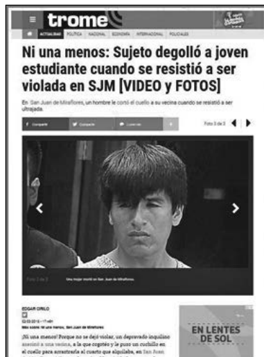
Figura 4 Narrativa canónica del diario Trome

«Ni una menos: Sujeto degolló a joven estudiante cuando se resistió a ser violada en SJM [VIDEO Y FOTOS]», por web del diario Trome , 2018 ( https://trome.pe/actualidad/crimen-estudiante-degollada-violacion-san-juan-miraflores-video-fotos-77191 ).