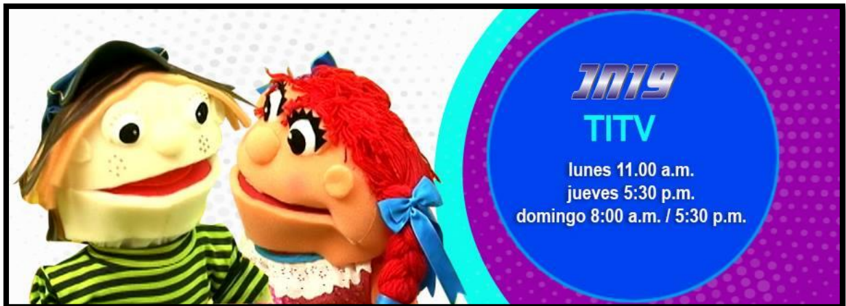
Figura 2. Afiche de presentación del microprograma