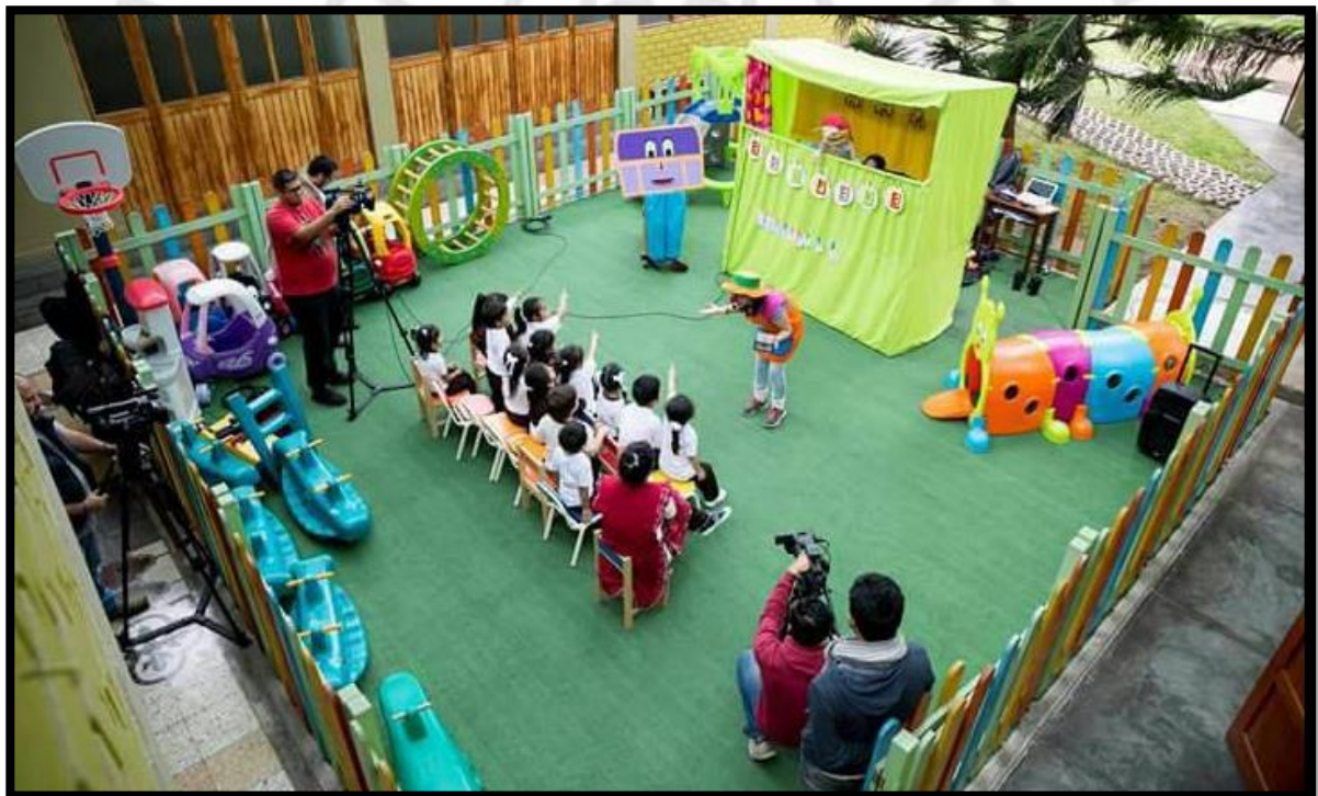
Figura 3. Durante la grabación de sesiones