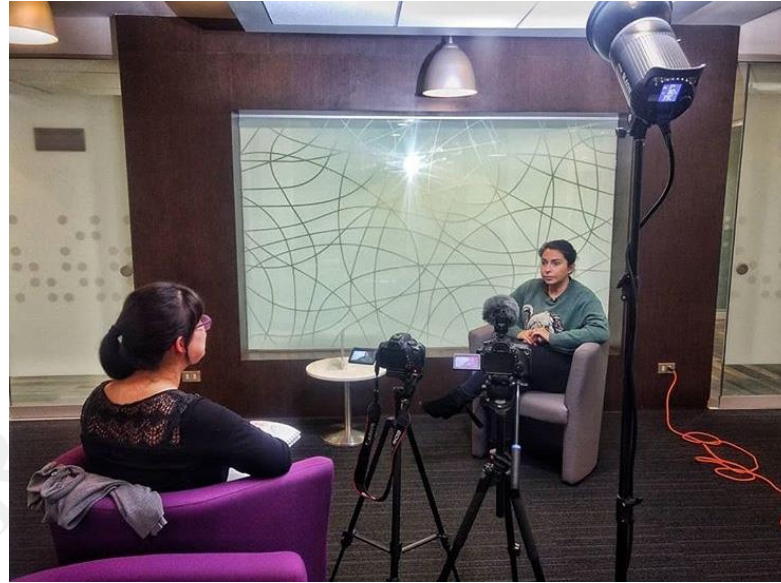
Tomas para el testimonio de la víctima de violencia doméstica: